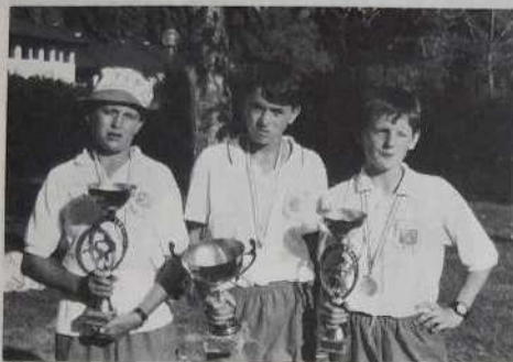
Sous-champions de France cadets.