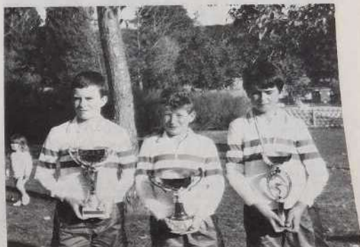
Champions de France cadets.