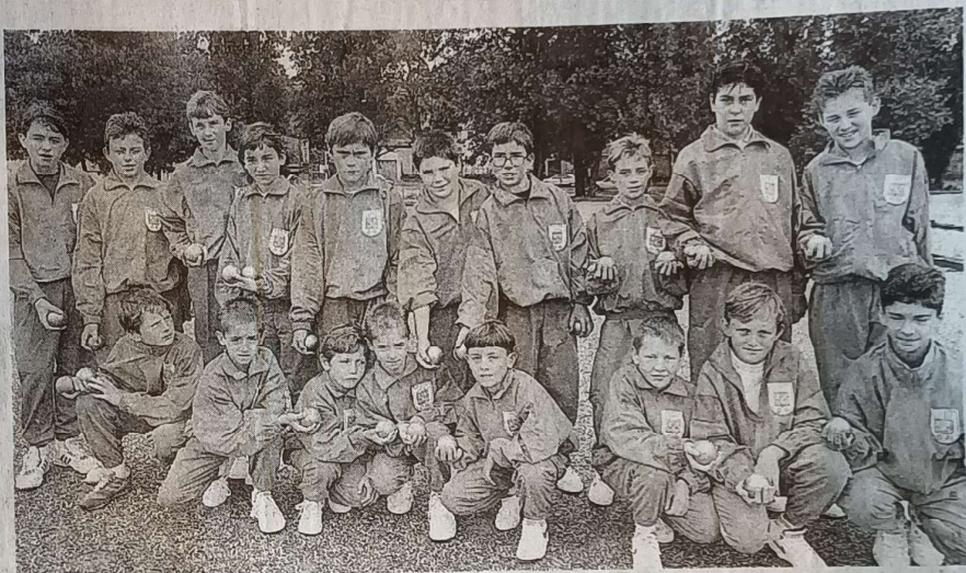
18 pétanqueurs, minimes et cadets, défendent les couleurs du Maine-et-Loire