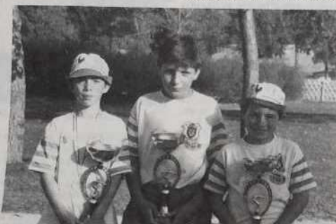
Sous-champions de France minimes.