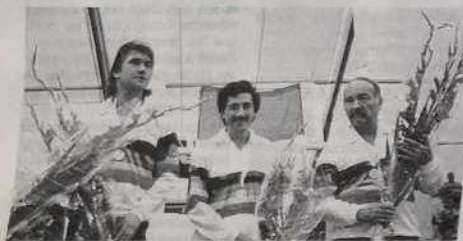
Les champions du monde.