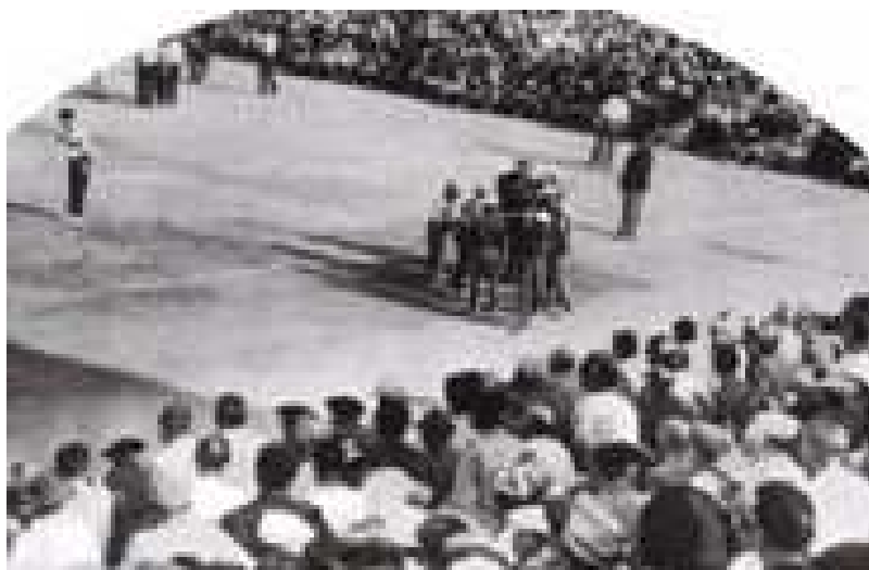
Une vue générale des terrains lors des phases finales de ce Championnat cadet à Bordeaux en 1962