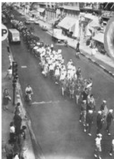
Les équipes et leurs délégués qui ont défilé à travers Bordeaux, avant de débiter ce Championnat de France

Avant le début de la compétition, toutes les équipes et leurs délégués ont défilé au travers de la ville de Bordeaux.