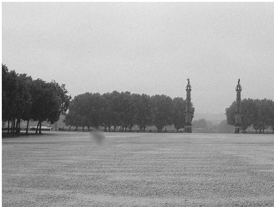
L'immense place des Quinconces à Bordeaux, où s'est déroulé ce 1 er Championnat de France pétanque cadet

Le tout premier Championnat de France pétanque cadet Triplette , s'est déroulé le 1 er et 2 septembre 1962 à Bordeaux (33).