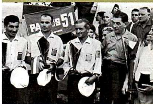
Vainqueurs 1 re catégorie, recevant leurs coupes entourant le président national.