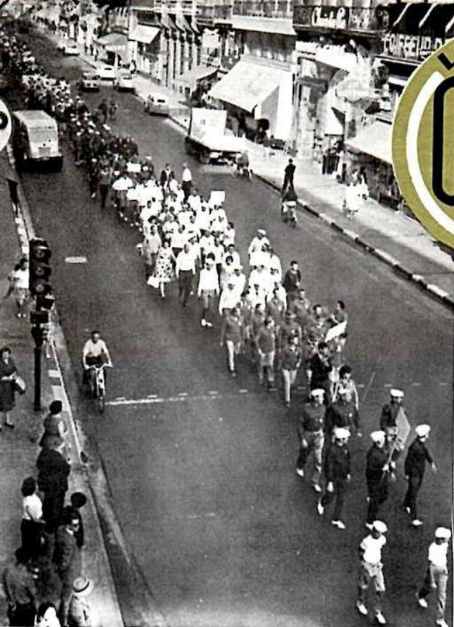
Défilé des différentes équipes dans les rues de Bordeaux