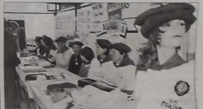
Hôtesse avec bérêts du Sud-Ouest

Coiffées de bérêts rouges, de souriantes hôtesse proposaient de nombreux articles promotionnels sur le thème de la pétanque et du sud-ouest de la France. Un accueil de charme auquel succombèrent bien des participants et spectateurs.