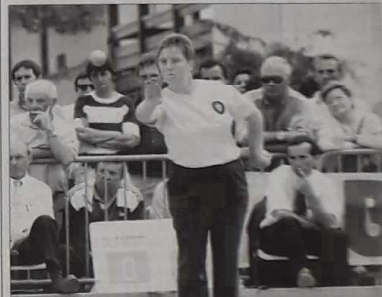
Les féminines représentent 14 % des effectifs licenciés en France, et 18 % dans les Landes

Le tirage au sort effectué au siège du Comité départemental des Landes a déterminé les rencontres de poule qui lanceront la compétition.