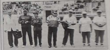
La finale de la coupe des Dom-Tom trouva son épilogue au terme de 11 menés

En finale, dimanche dans les arènes de Soustons, la Polynésie française représentée par Tahiti a été défaite par l'équipe de la Martinique