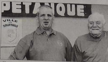
« Nous apportons notre quote-part à ce championnat de France de féminines en doublettes »