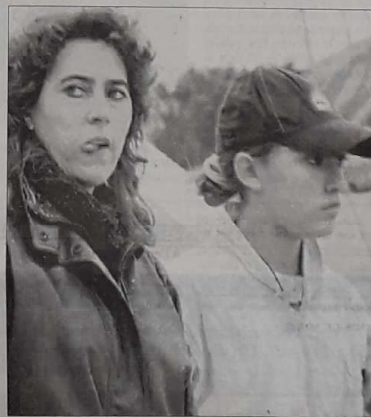
L'équipe de Saint-Sever