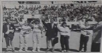
Les finalistes saluant après la compétition