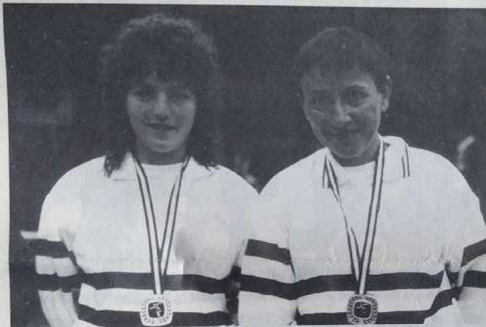
Les championnes de France arborant leurs nouveaux maillots et les médailles d'or de la F.F.P.J.F.