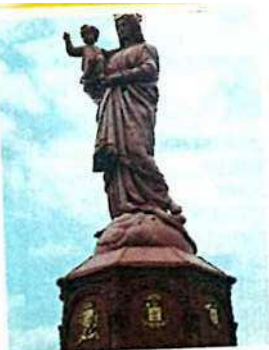
Notre-Dame du Puy