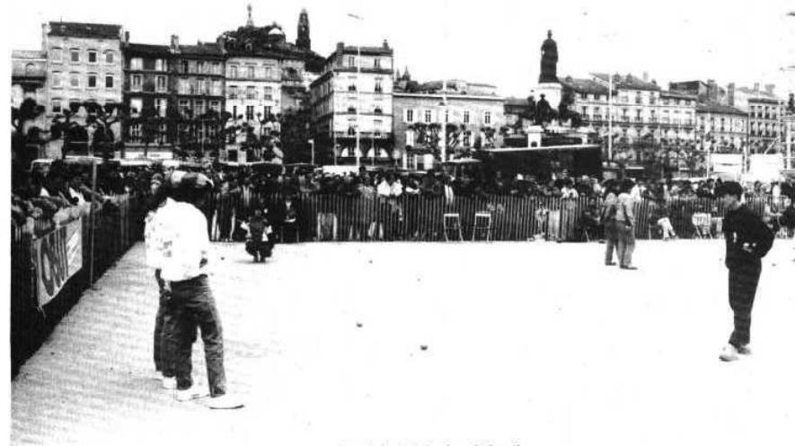
Vue générale de la place du Breuil.

● HUMOUR... QUAND TU NOUS TIENS !! Entendu, sous forme de devinette, dans un groupe de personnes apparemment sérieuses : - Quel est le plus beau rêve d'une boule de pétanque ? - L'amour des suçons... et la vie à la colle avec le but. Un rêve... cochonnet !!