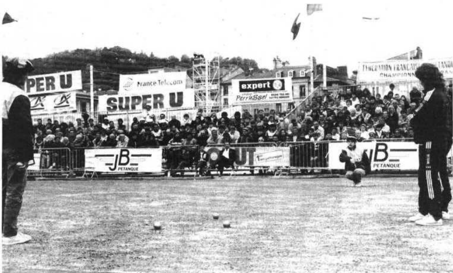
La finale dans le carré d'honneur : une partie pleine de tension. Les joueuses de Montpellier sont à droite.