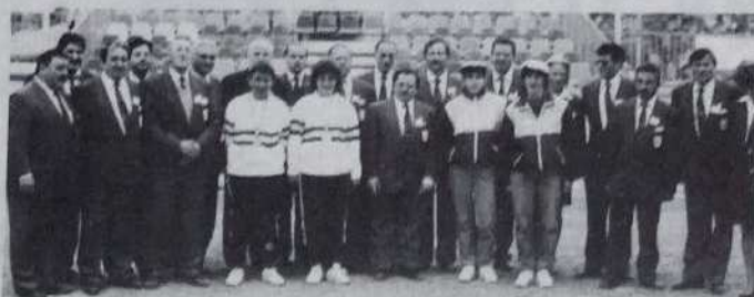
Les finalistes et le comité.