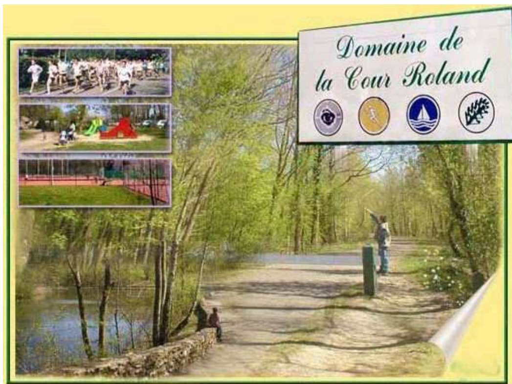
Le Domaine de la Cour Roland, où s'est déroulé ce Championnat de France, en 1992 à Jouy-en-Josas

C'est la ville de Jouy-en-Josas (78), qui a été l'hôte de ce Championnat de France féminin pétanque.