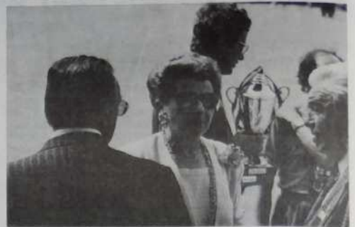
Madame le maire de Jouy-en-Josas.