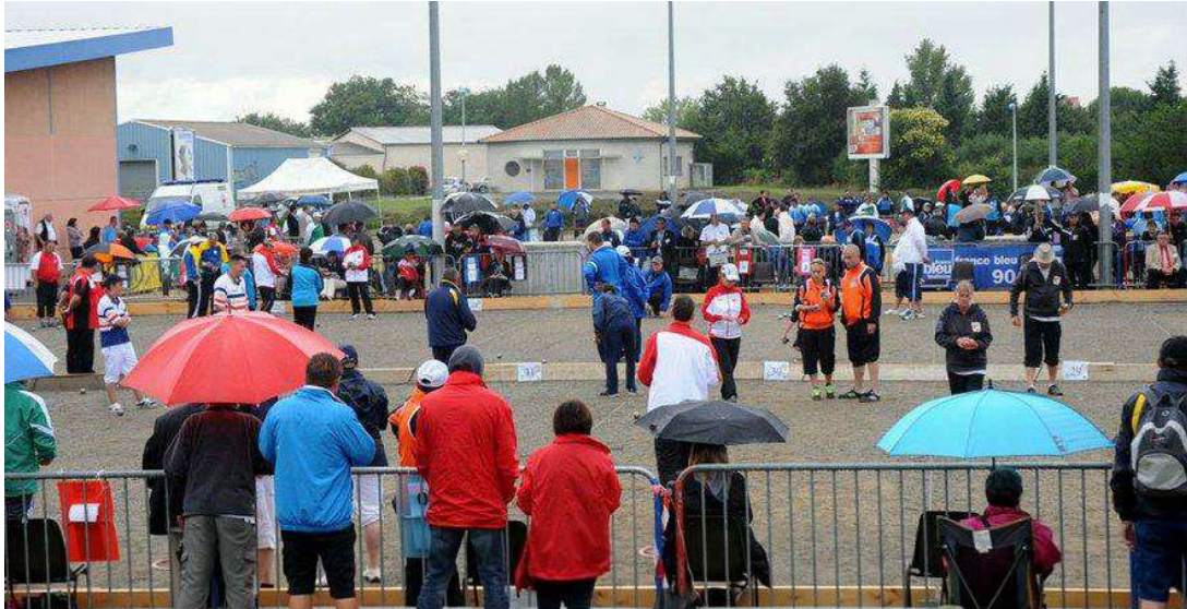
Que l'on se rassure, les parapluies ont été vite repliés.