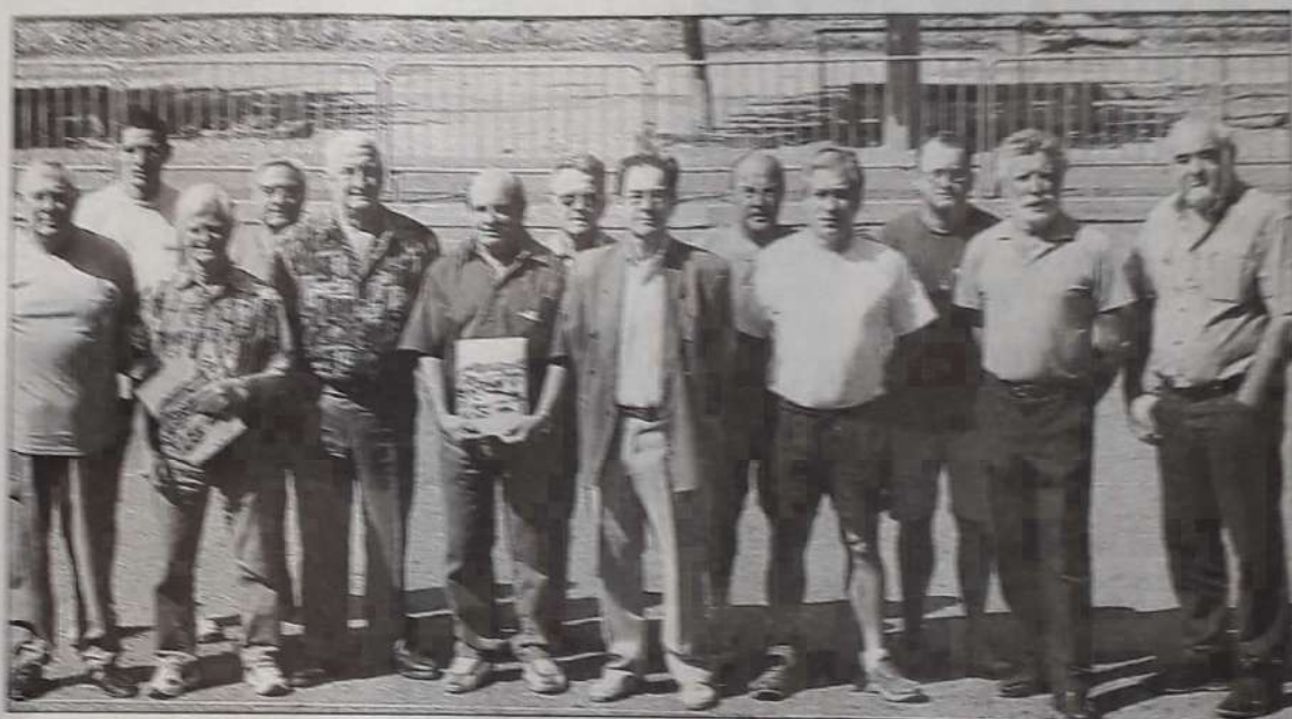
UBQ, municipalité et comité de l'Aude : prêts pour ces championnats de France.

Cet événement sans précédent sur la ville de Quillan sera le cinquantième