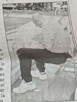
Les sportifs ont dû s'occuper le temps de l'interruption.