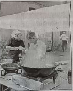
Escargots à déguster pour se sustenter entre deux matchs.

Hier, tout le monde n'avait d'yeux que pour les dizaines de parties s'enchaînant tout au long de la journée. Mais les à côtés d'un tel événement méritent pourtant un brin d'attention : nombreuses sont les opportunités d'aborder les joueurs entre deux matchs. Certains vont même jusqu'à s'isoler pour s'échauffer, seuls, avant de rejoindre leur coéquipier. L'individualisme au service du collectif.