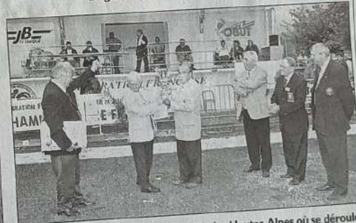
Le passage du flambeau à Laragne dans les Hautes-Alpes où se déroulera le championnat de France 2004.