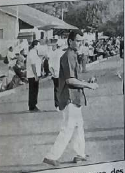
Un public nombreux vaque des stands aux parties.

Sans atteindre bien sûr l'engouement lié aux parties, les stands montés devant l'Espace Cathare ne manquent pas non plus d'animation. Si on vient surtout étancher sa soif ou apaiser sa faim, beaucoup d'amateurs alimentent aussi leur passion en comparant les dernières boules en vente sur place. La fréquentation tient donc ses toutes promesses, à peine éclipsée hier par quelques gouttes de pluie en fin d'après-midi. Les rencontres sont variées, passant du compétitif à sa famille venue l'encourager. Sans compter les touristes se retrouvant là par hasard, à l'image de cette Anglaise ravie de photographier une manifestation "purement française". Pas besoin de s'y connaître pour savourer le Jeu Provençal.