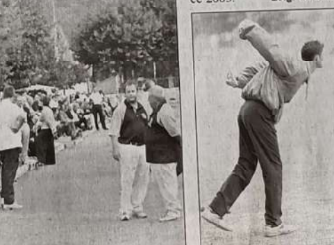
Le pointeur doit se tenir sur une jambe. Il y avait de drôles de cigognes au boulodrome.

Aujourd'hui, dès 9 h, se dérouleront les 1/2 finales sur les terrains d'honneur et, à 14 h 30, la grandiose finale verra le sacre des Champions de France 2003.