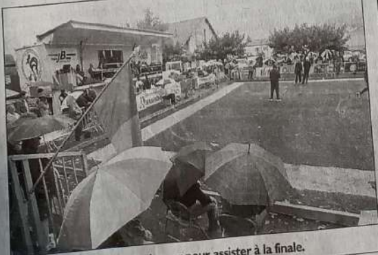
Les parapluies étaient de rigueur pour assister à la finale.

Il ne faut pas oublier de préciser que l'espace des bouledromes quillanais permet le développement du Jeu Provençal qui demande une surface de 100 m 2 par jeu. 6 000 m 2 ont été nécessaires à Quillan pour organiser ce championnat de France.