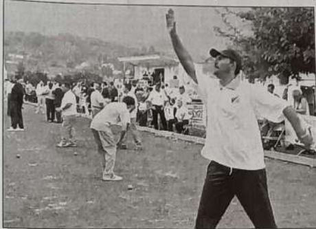
Baucoup de joueurs furent surpris par la "mollesse" des terrains, peu propices aux rebonds. Adaptation de rigueur.

Les équipes devaient remporter deux parties pour sortir des poules.