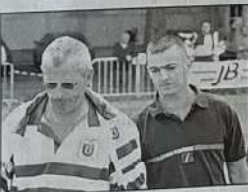
Suite au malaise d'un de ses joueurs, l'équipe de Vienne s'est retirée de l'épreuve.

Alors qu'il disputait l'épreuve de cadrage lui permettant d'accéder au 8 e de finale du Championnat, un pétanqueur d'une équipe de Vienne a, subitement, été pris d'un malaise, hier à 9 h sur le boulodrome.