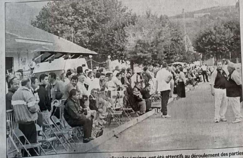
De nombreux spectateurs, muets pour ne pas gêner les équipes, ont été attentifs au déroulement des parties.