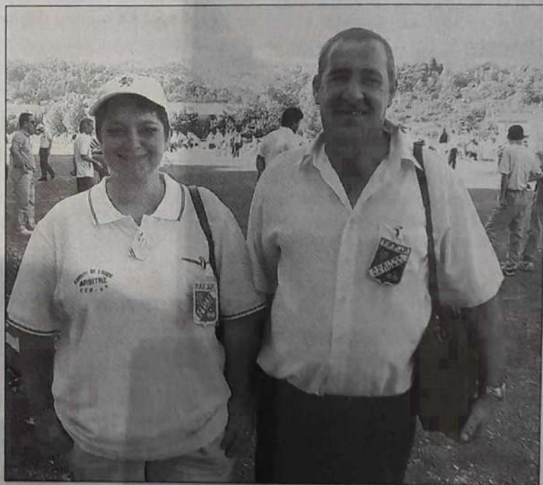
■ Les arbitres sont aussi du championnat.