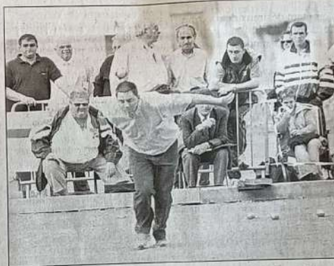
Le tireur doit lâcher sa boule soit à la fin du 3 e pas et, au plus tard, avant le 4 e appui.