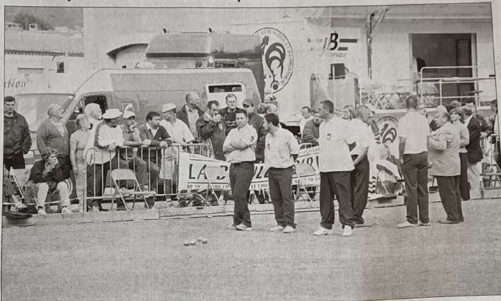
Durant ces trois jours, des parties acharnées se sont déroulées sur le boulodrome en présence d'un nombreux public.