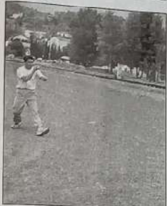
Echauffement en solitaire avant la prochaine partie.

Hier, tout le monde n'avait d'yeux que pour les dizaines de parties s'enchaînant tout au long de la journée. Mais les à côtés d'un tel événement méritent pourtant un brin d'attention : nombreuses sont les opportunités d'aborder les joueurs entre deux matchs. Certains vont même jusqu'à s'isoler pour s'échauffer, seuls, avant de rejoindre leur coéquipier. L'individualisme au service du collectif.