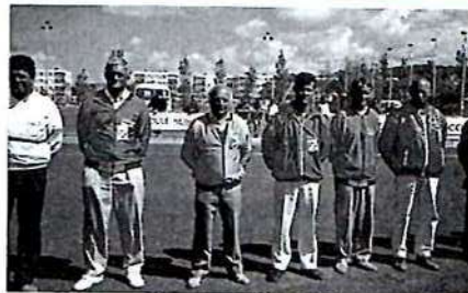
Le corps arbitral.