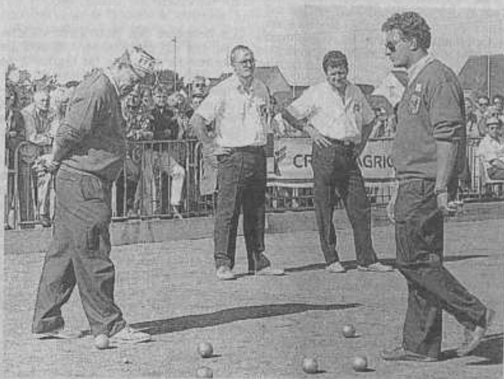
Les Gardois équipe vainqueur au centre.

nats de France ont pris de l'épaisseur. On joue plus serré entre initiés, suspense et spectacle garantis. On mesure l'adversaire puis l'accent se réveille, la Provence s'affirme.