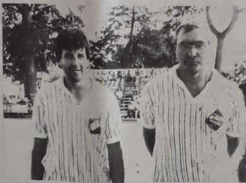
Equipes demi-finalistes : SIGAL et BERTRAND.

Un éventail de quatre équipes de « ténors » du jeu provençal s'opposera aujourd'hui, au cours Foucault, en demi-finales et finale de cette quatorzième édition du championnat de France. Place aux virtuoses.