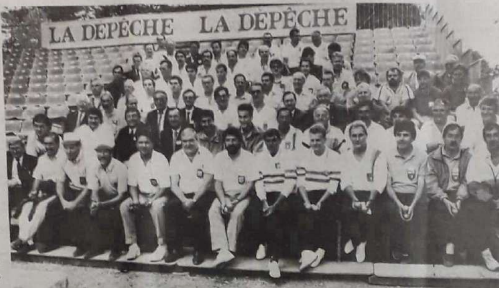
La pyramide du cours Foucault ou les champions du jeu provençal réunis, entre deux parties, sur les tribunes du terrain central. Ne cherchez pas une région manquante : le jeu provençal, comme son nom ne l'indique pas, est un sport décentralisé et toutes sont représentées.

La première journée de cette quatorzième édition du championnat de France de jeu provençal aura été marquée par la diversité des résultats obtenus. Si certaines sorties de poules furent victorieuses, comme c'était le cas pour l'équipe de Tarn-et-Garonne, d'autres ne purent éviter une défaite dès les premières parties. Tout cela dans une ambiance des plus méridionales.