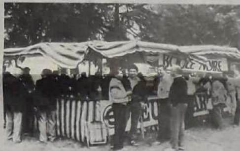
Le championnat de jeu provençal, c'est aussi un moment de détente et de fête où tout le monde se retrouve, après la compétition, devant la buvette.