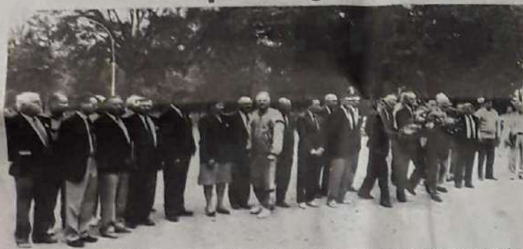
La compétition était interrompue, hier, quelques minutes, durant le dépôt de gerbe devant le monument aux morts du cours Foucault. Autour du maire de Montauban et du président de la fédération, c'est toute une foule d'amis qui participaient à cette commémoration.