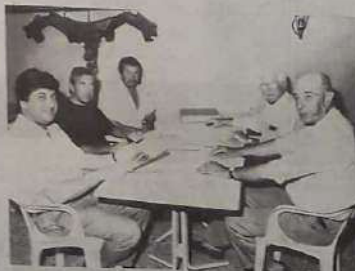
Le comité départemental réuni pour le tirage du tableau.

Le service médical sera assuré par le Croix-Rouge française.