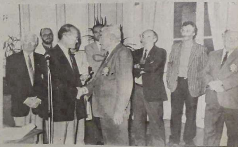
C'est toute une fédération qui a reçu, avant-hier, la médaille de la ville.