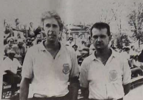
D'HERVILLY et RUIZ.

bataille recommence. A 9 heures, auront lieu les demi-finales, la finale débutant, quant à elle, à 14 h 30.