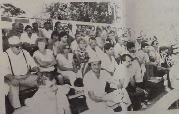
Le public : de vrais supporters du jeu provençal.

Le championnat du monde de pétanque en féminin doublettes aura lieu à Bangkok (Thaïlande), du 21 au 24 novembre. Le championnat du monde de triplettes hommes se déroulera du 4 au 7 octobre, à Monaco.