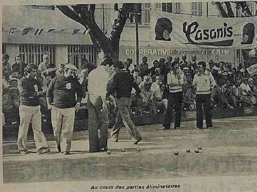
Au cours des parties éliminatoires

Massoni (B.-du-Rhône) bat Magenty (Pyr.-Orient.) 13 - 1.