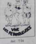
Ref. T 04