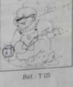
Ref. T 05