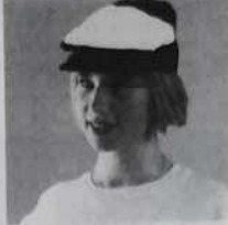
Casquette bouliste - Ref. C 01 multicolore ou blanche 30 francs ou 3 bons parrainage