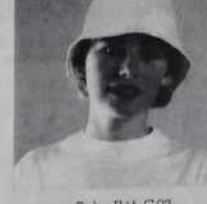
Bob - Ref. C 03 blanc/bleu, blanc/rouge 25 francs ou 2 bons parrainage