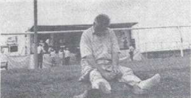
Déception quand tu nous tiens.