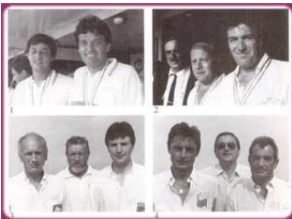
Les 4 Doublettes 1/2 finalistes de ce Championnat de France à Reims :