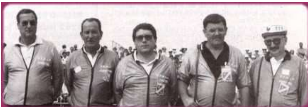
Le corps arbitral de ce Championnat de France pétanque en 1991 à Reims (51)