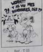
Ref. T 03