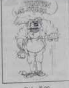
Ref. T 02