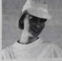
Casquette base-ball - Ref. C 02 blanche, blanc/jaune blanc/bleu, blanc/orange 15 francs ou 1 bon parrainage