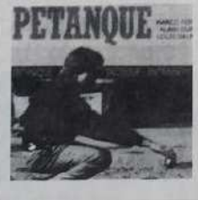
BANDEAU BLANC imprimé "La Gazette du Pétanqueur" 10 Fr. ou 1 bon parrainage

BUT BOIS PEINT FLUO inscription : "La Gazette du Pétanqueur" 3 Fr. pièce ou 20 Fr. les 5 35 Fr. les 10 Couleurs assorties