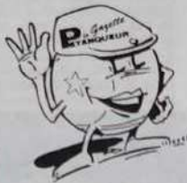
Design figurant sur les 3 articles ci-contre

Tailles : S/M - L - XL : 80 Francs ou 8 bons parrainage de 2 à 14 ans : 60 Francs ou 6 bons parrainage