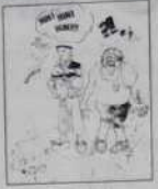
Ref. T 01