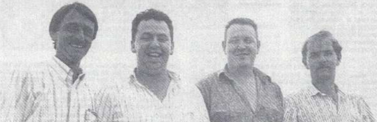
L'équipe andornaise au grand complet.