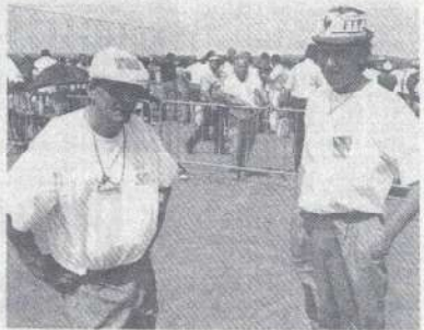
Carrey-Moucheron : la paire régionale est sortie très déçue de ces championnats 91.