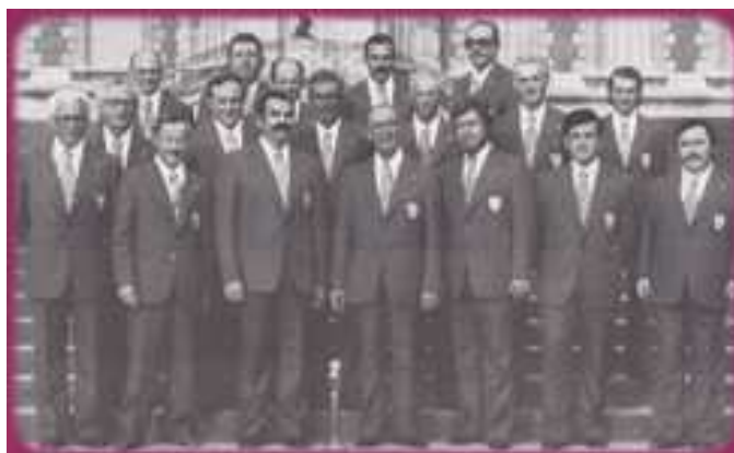
Le Comité d'Organisation de ce Championnat de France à Bagnex (92) en 1978