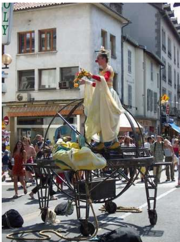
La ville d'Aurillac et son célèbre festival de théâtre de rue

Ce Championnat de France Tête-à-tête senior pétanque , s'est déroulé les 30 juin et 1er juillet 2001 à Aurillac (15).