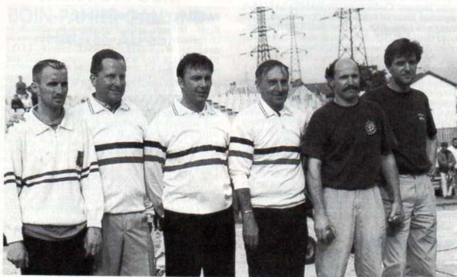
Le podium des championnats de France doublette et tête à tête.