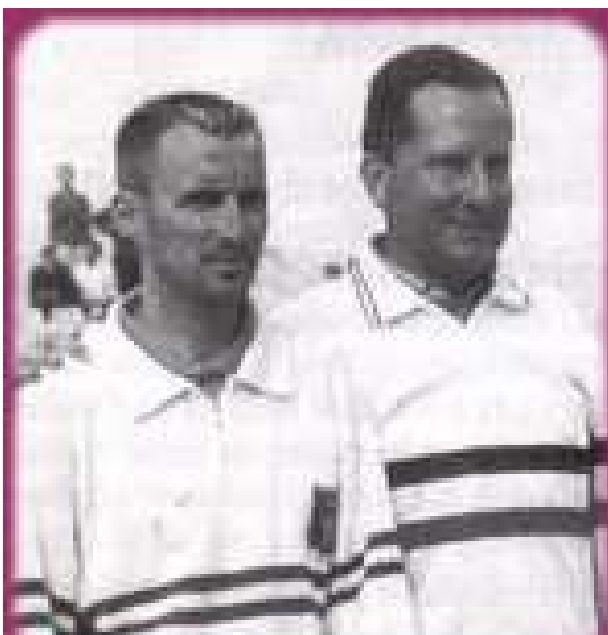
Le Champion du (30)