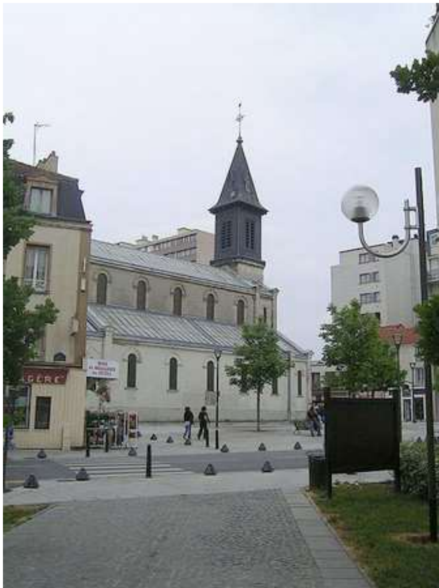
Le centre-ville de Rosny-sous-Bois et son église Sainte-Geneviève

Ce Championnat de France Tête-à-tête senior pétanque , s'est déroulé les 6 et 7 juillet 1996 à Rosny-sous-Bois (93).