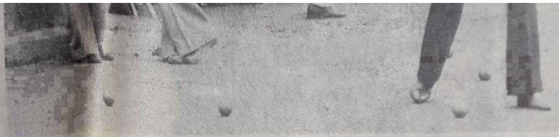
CANAVA - Patrick BARATAUD se qualifièrent en doublettes pour les huitièmes de finale après une partie très disputée contre les Nantais OLMOS frères. Ils avaient éliminés auparavant COULOUBRIER - LEBOULANGER (à droite) (Sarthe).