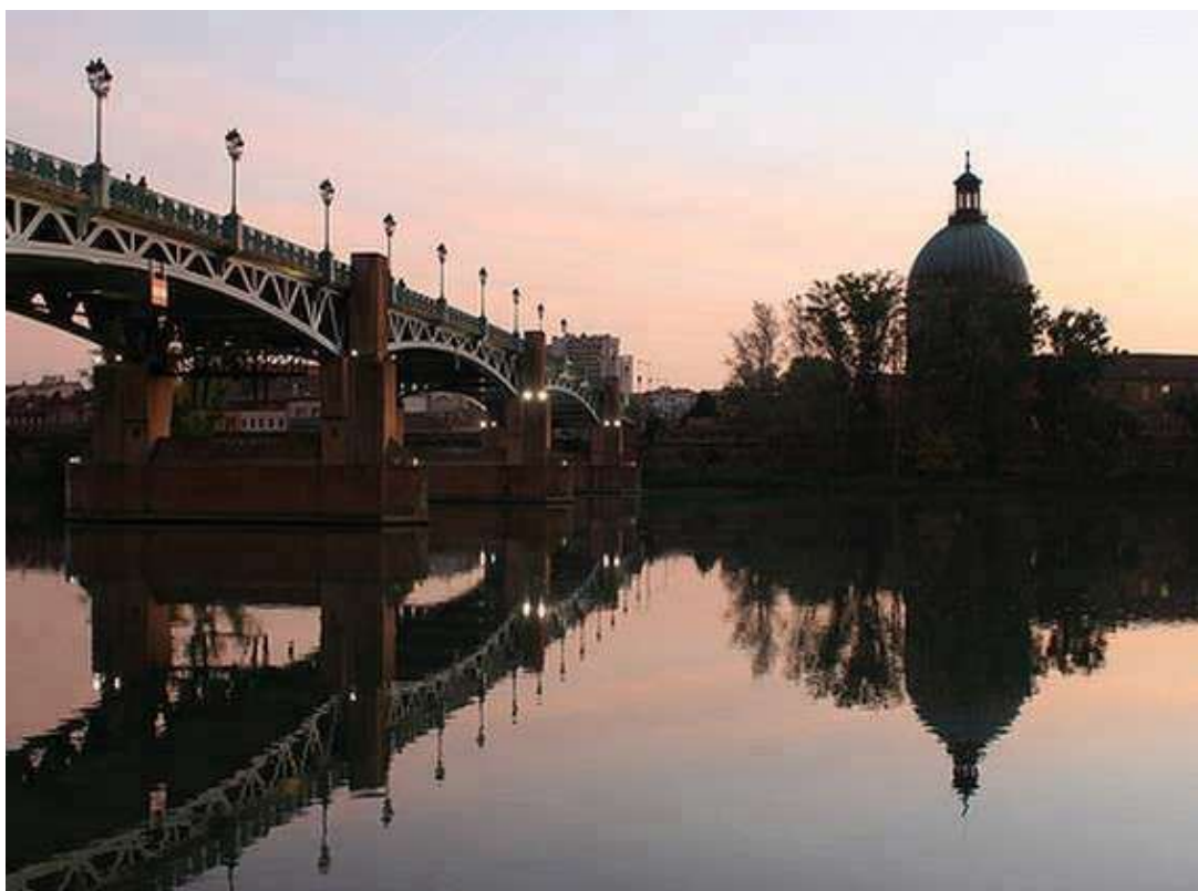
Le Dôme de l'hôpital de la Grave et le pont Saint-Pierre, vus de la fameuse place, où se sont déroulés les célèbres 3 jours de Saint-Pierre à Toulouse

Ce Championnat de France Tête-à-tête senior pétanque , s'est déroulé les 9 et 10 juillet 1977 à Toulouse (31).