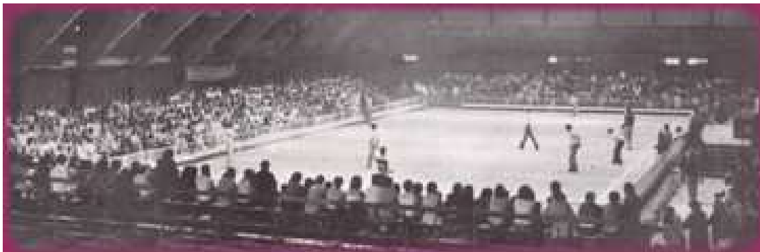
Une vue générale des terrains dans le hall Gascogne le dimanche après-midi