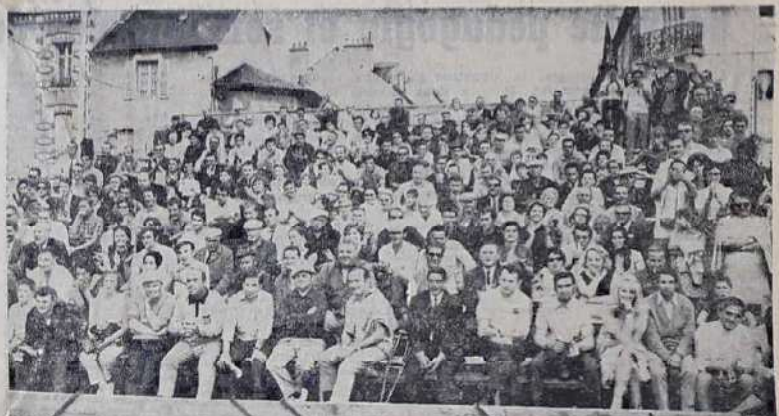
Une vue générale d'une partie du public neversais installé dans la tribune principale adossée à la rue Henri-Barbuse

Engagé samedi sous les auspices et patronné par un véritable « club » méridional (dont on veut oublier les bouderies des premières heures dominicales) le IV e Championnat de France de Pétanque en tête à tête a connu, hier après-midi, un final éblouissant dans ce petit « cadre d'honneur » du parc municipal de Nevers célébré par près de deux mille spectateurs littéralement enthousiasmés et conquis par « les belles années » et leurs prestigieux ambassadeurs.