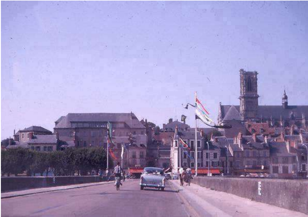
Le pont de Nevers, qui enjambe la Loire, dans les années 60, avec à droite la cathédrale Saint-Cyr

Ce Championnat de France Tête-à-tête senior pétanque , s'est déroulé à Nevers (58) en 1969.