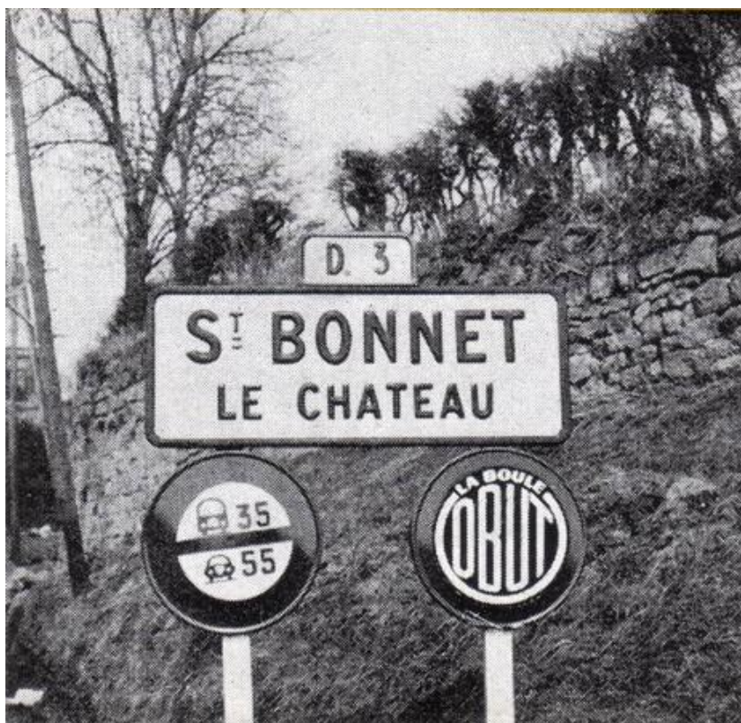
Ce Championnat s'est déroulé à Saint-Etienne, tout proche de la Capitale mondiale des boules de pétanque. Saint-Bonnet-le-Château et la Boule OBUT, sont mondialement connus