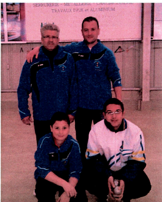
Champions doublette séniors

Et bien pour 2013, nous avons décroché les titres