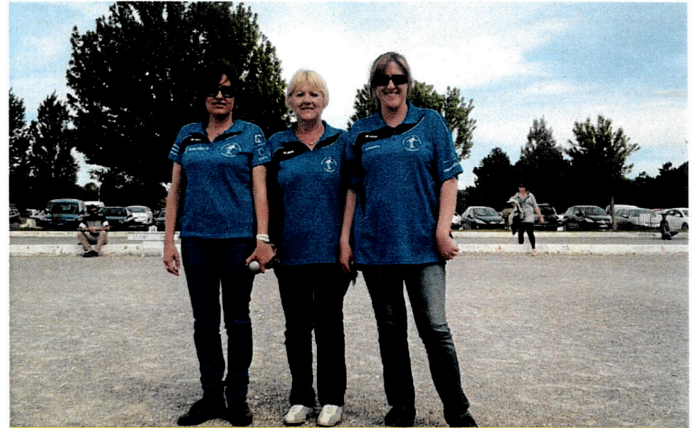
Championnes triplette féminines

Pour ce qui concerne la coupe de France, nous avons atteint le 1er tour au niveau régional que nous allons défendre pro-