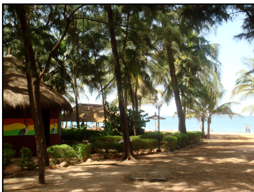
Paillote et front de Mer