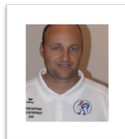
Champion Europe des clubs 2011 avec Monaco

FRAIS D'INSCRIPTION 120 € /triplette - 40 € / doublette