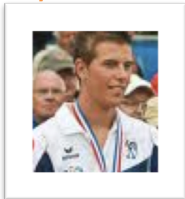
Champion du monde 2012