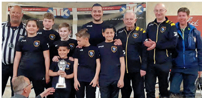
Champion CDC Benjamins / Minimes 2019 Fonsorbes - Plaisance - Tournefeuille