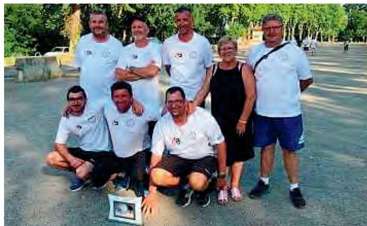
Championnat Départemental des Clubs CDC1 Jeu Provençal 2019 Champion, le Club de Castanet