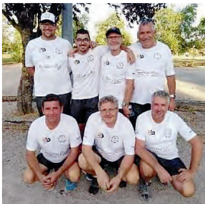
Championnat Régional Occitanie CRC Jeu Provençal 2019 Champion, le Club de Castanet