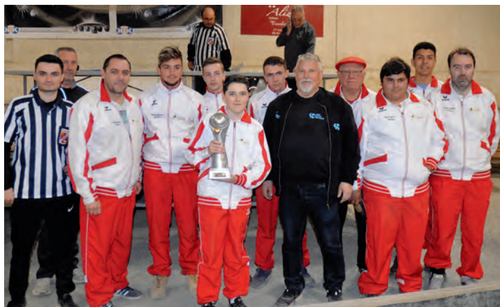
Champion CDC Cadets / Juniors 2019 Entente Saint-Alban / Fronton