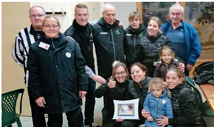
Championnat Départemental des Clubs CDC Féminin 2019 Champion, le Club de Launaguet