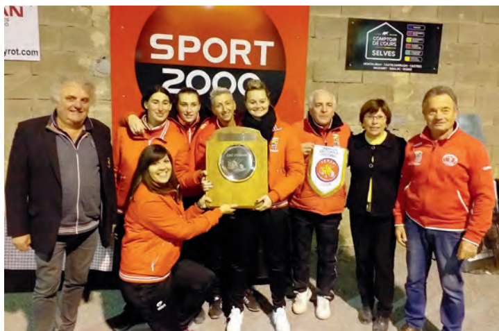
Championnat Régional Occitanie CRC Féminin 2019 Champion, le Club de Cazères