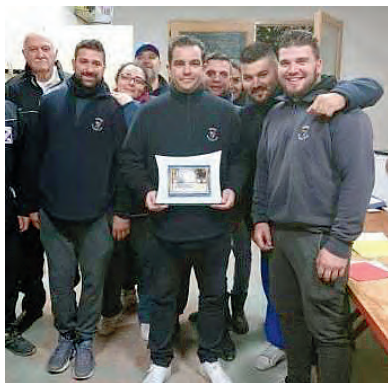
Championnat Départemental des Clubs CDC Open 2019 Champion, le Club de Roques