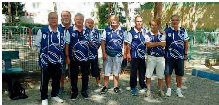
Championnat Départemental des Clubs CDC Vétéran 2019 Champion, le Club de la BJ Colomiers